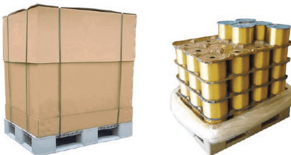
Рисунок 3 — Пример упаковки в тару