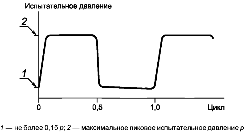
Рисунок F.1 — Цикл импульса давления