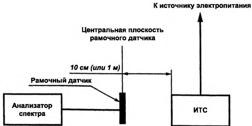
Рисунок А.2 – Испытательная установка для измерения магнитного поля, создаваемого ТС