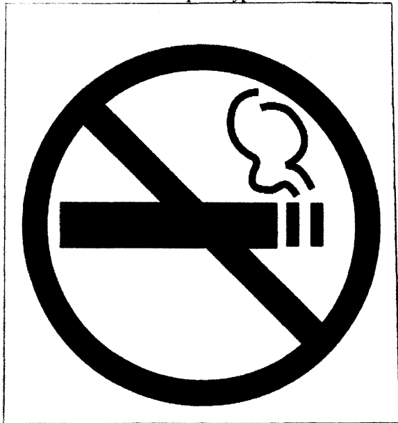
Знак о запрете курения