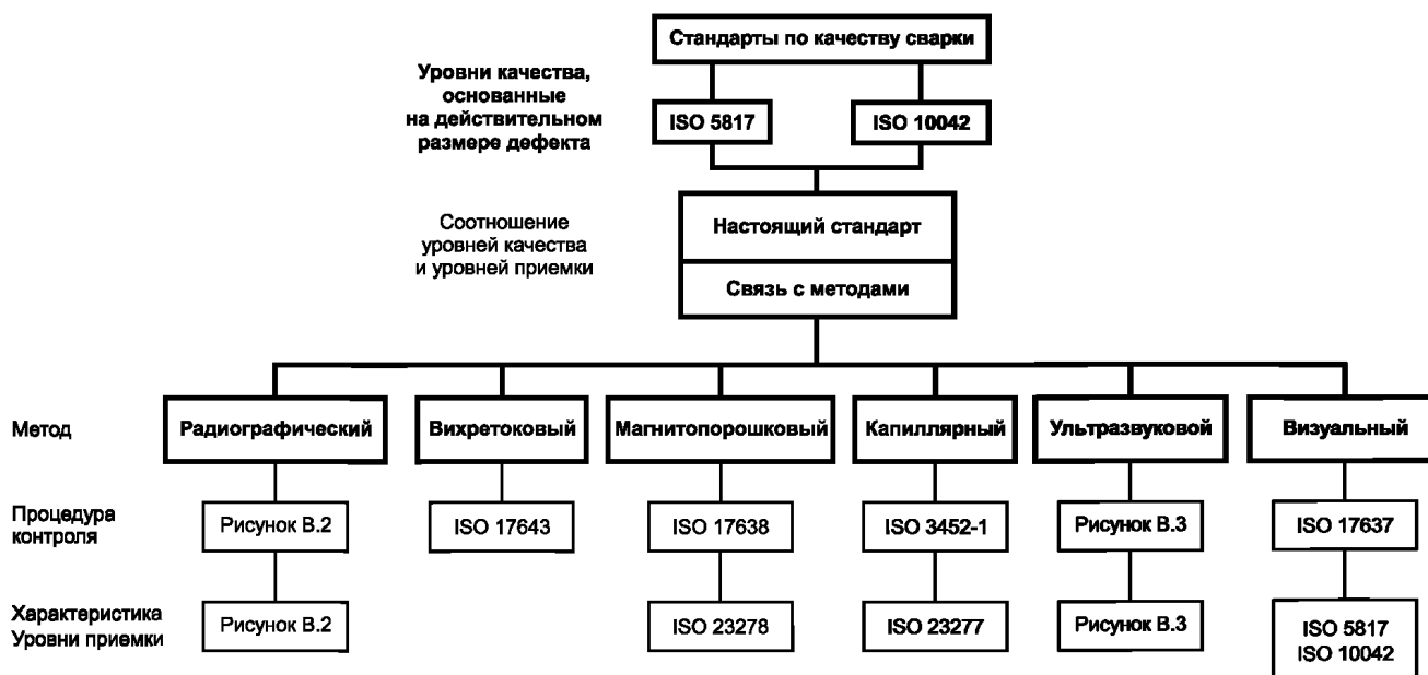
Рисунок В.1 — Диаграмма взаимосвязи стандартов

Диаграмма взаимосвязи стандартов представлена на рисунках В.1, В.2 и В.3.