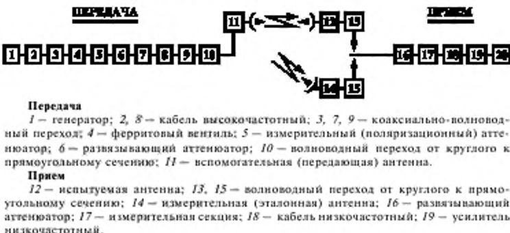
Рисунок Б.2 — Структурная схема измерения диаграммы направленности (измерительные аттенуаторы расположены на приеме)

Примечания 1 При использовании волноводного тракта с гибкими волноводными вставками и приемно-передающей аппаратуры с волноводными входами (выходами) кабели высокочастотные и коаксиально-волноводные переходы из схемы исключаются. 2 При прямоугольном сечении волноводного выхода облучателя волноводные переходы от круглого к прямоугольному сечению не используются.