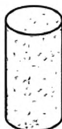
Рисунок 2 — Агломерированная корковая пробка

4.1.2 Агломерированные корковые пробки — это пробки, корпус которых целиком состоит из агломерата (рисунок 2). Пробки этого типа не следует использовать для игристых вин.