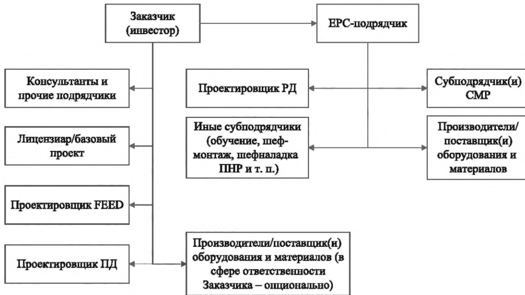
Рисунок 1 — Вариант 1 контрактной стратегии реализации крупного строительного проекта с использованием интегрированного контракта EPC

7.6 Вариант 2 контрактной стратегии реализации крупного строительного проекта с использованием интегрированного контракта EPC, представленный на рисунке 2, предусматривает расширение сферы полномочий и ответственности EPC-подрядчика и включает в границы его ответственности контракты с разработчиками комплексного базового проекта и ПД.