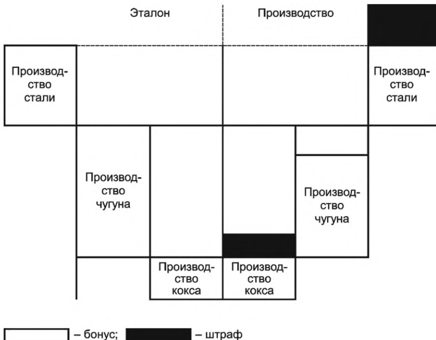
Рисунок 1 — Принцип оценки эффективности многостадийных производственных маршрутов