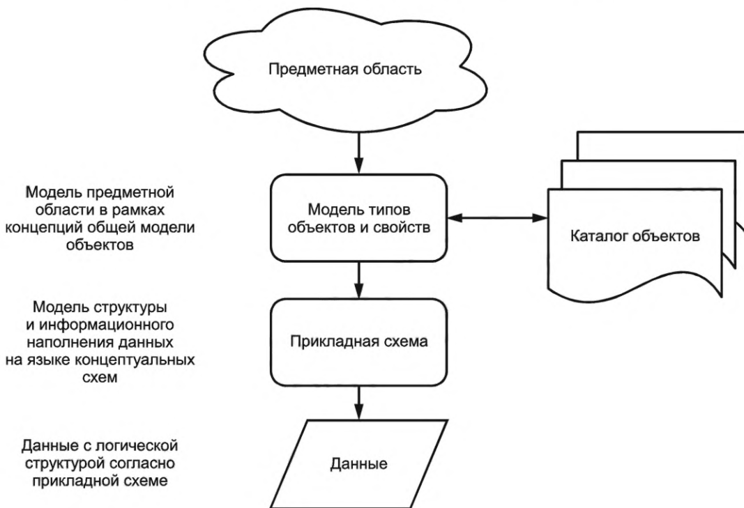
Рисунок 2 — Переход от реальности к пространственным данным (см. [5])