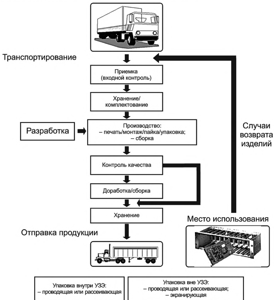
Рисунок A.2 — Применение антистатической упаковки

Примечание — На схеме приведен подход «островок безопасности» при обеспечении мерами защиты от ЭСР. Во многих производственных процессах используют подход «безопасность всего предприятия», при котором все производство представляет собой защищенную зону — см. рисунок A.1.