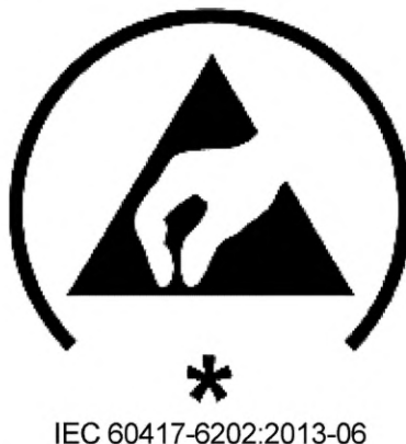
Рисунок 1 — Пример маркировки упаковки (*Код основного назначения)

Защитная антистатическая упаковка должна быть обозначена классификационным символом ЭСР, приведенным в [4] и как показано на рисунке 1, или другим способом в соответствии с контрактами заказчика, заказами на поставку, чертежами или другой документацией.