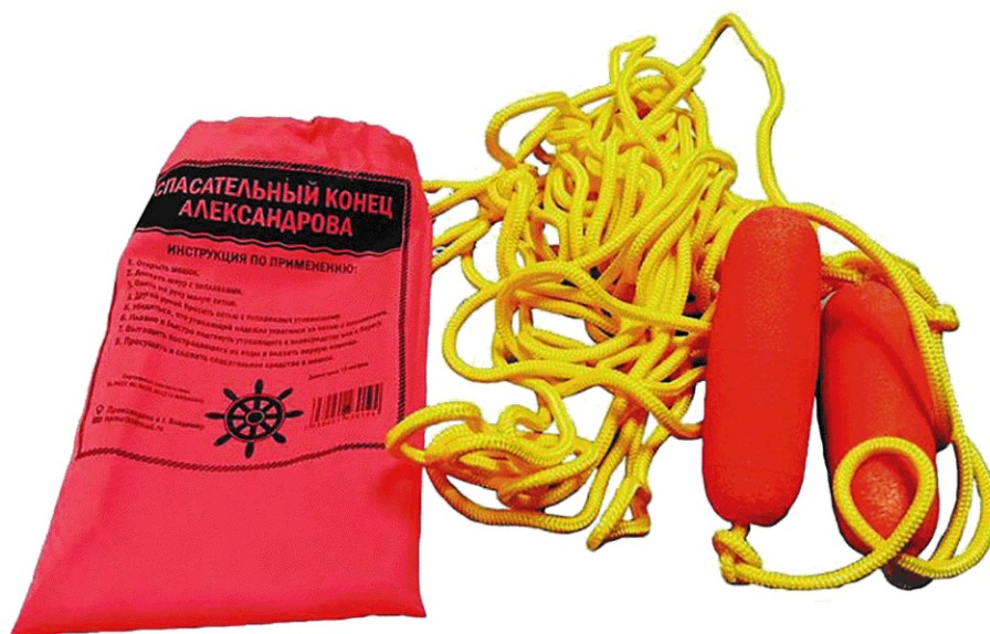
Рисунок 3 — Конец Александрова

5.3.1 Конец Александрова должен иметь плавучий линь длиной не менее \frac{2}{3} ширины ванны бассейна, а также фиксирующую петлю на кисть спасателя.