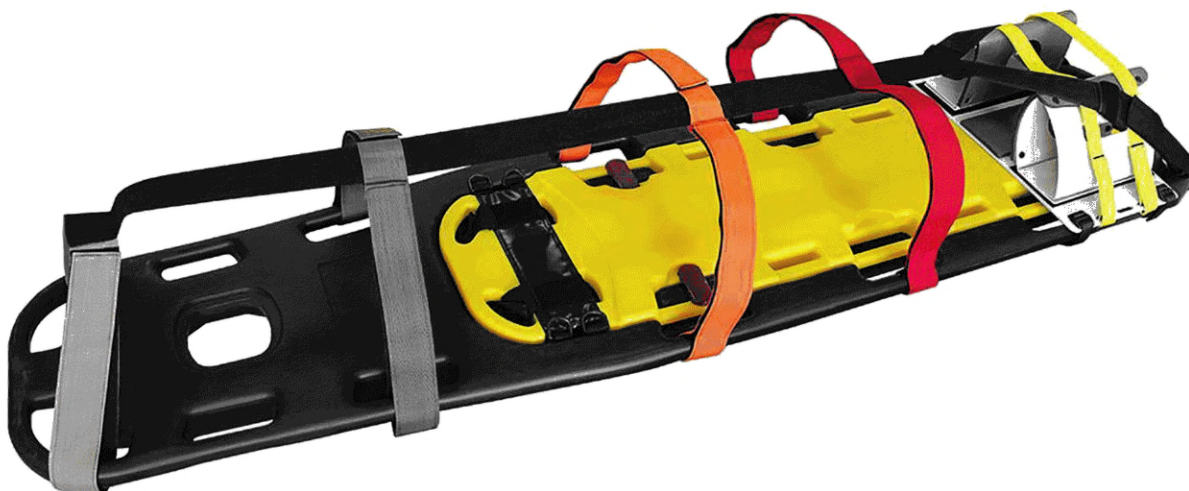
Рисунок 4 — Плот-носилки (спинборд)

5.4.1 Плот-носилки должен иметь плавающую жесткую конструкцию с ремнями фиксации (не менее трех), до 8 точек фиксации для детей и дополнительной точкой фиксации головы и шеи.