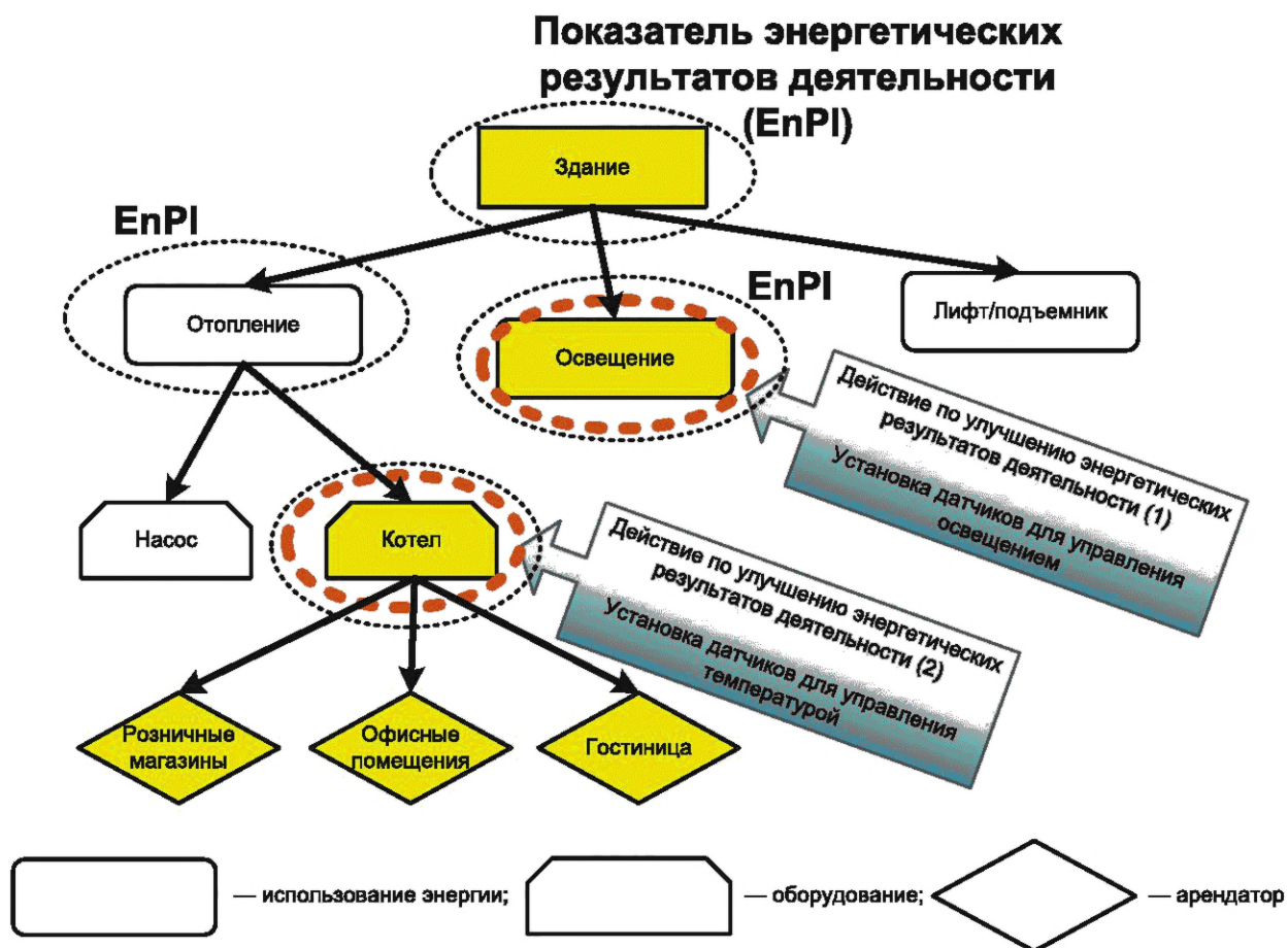
Рисунок 3 — Использование энергии в многофункциональном арендном здании

На рисунке 3 показаны использование энергии в многофункциональном арендном коммерческом здании и основные источники данных, необходимые для измерения результатов, достигаемых за счет двух действий по улучшению энергетических результатов деятельности.