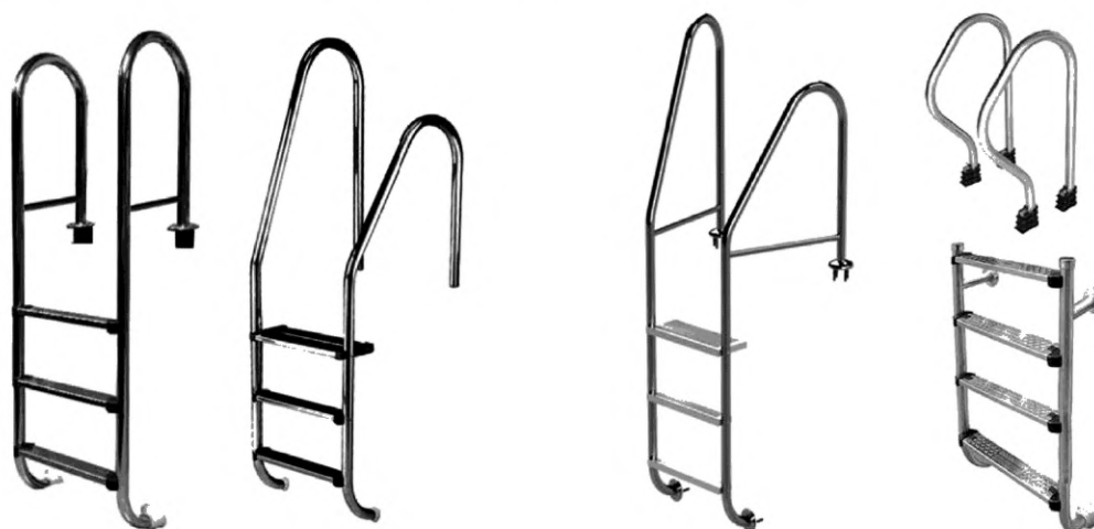
а – лестницы цельные с поручнями различной конфигурации

Общий вид лестниц различной конструкции показан на рисунке 2.