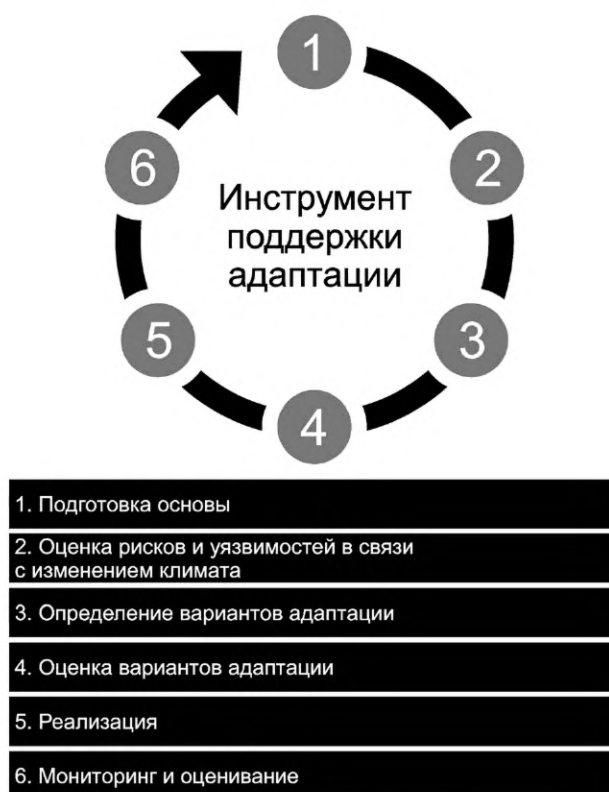
Рисунок В.1 — Инструмент поддержки адаптации

В основу инструмента положен циклический набор принципов (см. рисунок В.1), который подчеркивает, что адаптация к изменениям климата представляет собой итеративный процесс, позволяющий принимать решения на основании актуальных данных и знаний. Этот процесс поддерживается мониторингом и своевременной оценкой мер. Инструмент поддержки адаптации разработан при помощи утилиты UKCIP Adaptation Wizard и различных моделей для оценки рисков.