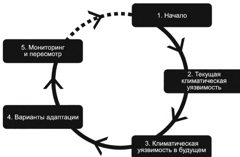
Рисунок В.3 — Мастер адаптации