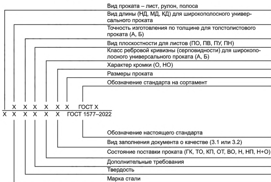
Схема и примеры условных обозначений проката

Примечание — Дополнительные требования указывают в соответствии с 7.3 и 7.4 в виде условных обозначений (например, «КИ», «1С»), при отсутствии условного обозначения — в виде ссылки на соответствующий пункт (например, «с учетом 7.3.1»).