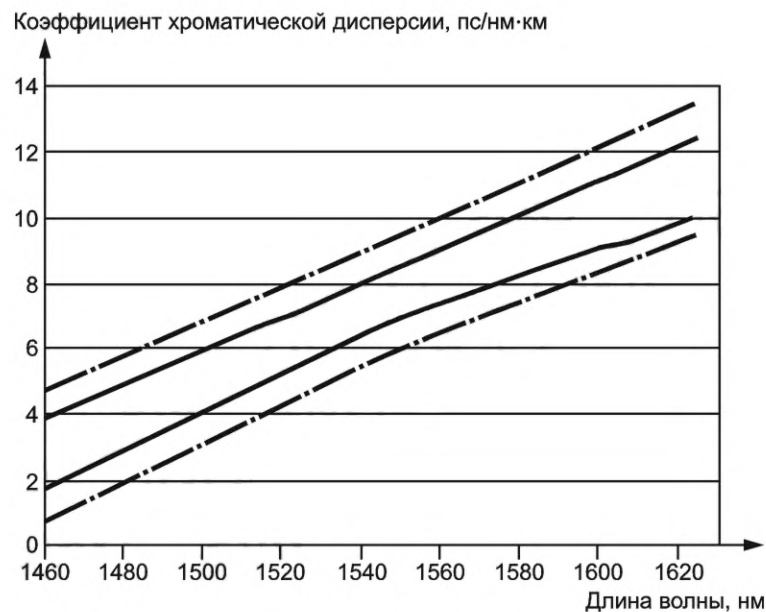
Рисунок G.2 — Предельные значения коэффициента хроматической дисперсии для ОВ подкатегории В-655.Е

На рисунке G.2 показаны предельные значения коэффициента хроматической дисперсии, соответствующего техническим требованиям, т. е. утроенное значение предела, соответствующего среднеквадратическому отклонению, и значения, которые могут быть использованы в системном проектировании, т. е. предел, соответствующий среднеквадратическому отклонению.