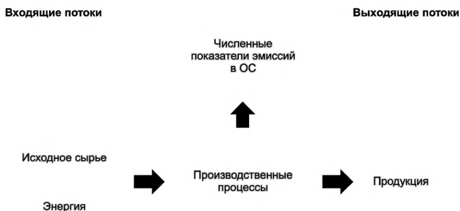
Рисунок 1 — Графическое изображение производственных процессов до реализации экологических проектов

9.4 Защита информации, полученной в результате сбора и анализа данных, осуществляется с учетом требований, установленных в [4].