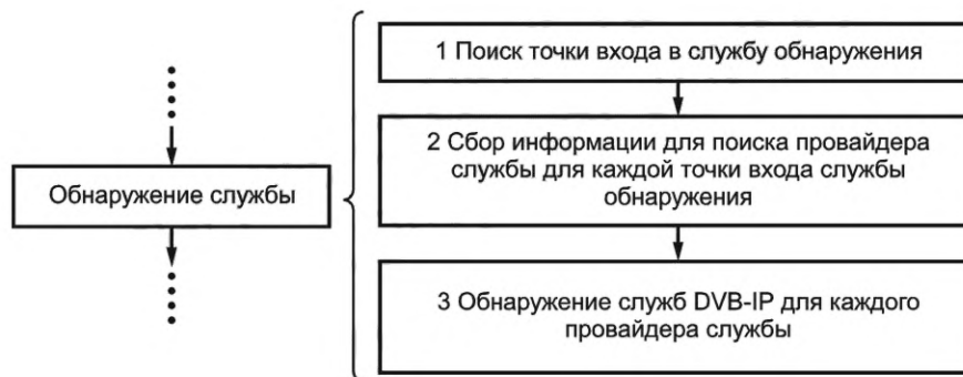
Рисунок 1 — Этапы процесса обнаружения служб

Этапы процесса обнаружения службы показаны на рисунке 1.