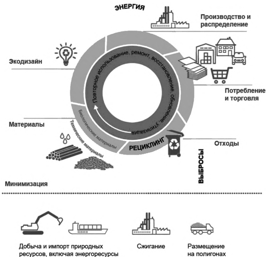
Рисунок 2 — Иллюстрация принципов экономики замкнутого цикла в контексте концепции ресурсосбережения

Географически меньшие циклы (повторное использование, ремонт, модернизация товаров), как правило, более прибыльные и ресурсоэффективные (из-за снижения транспортных и других транзакционных издержек).