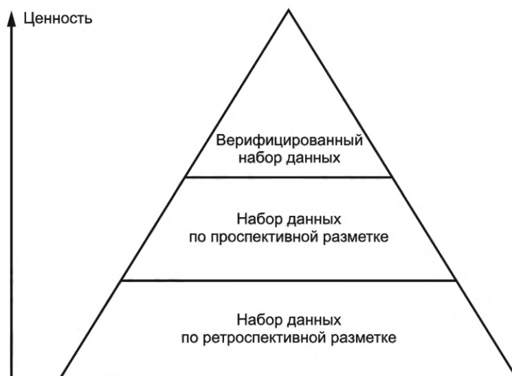
Рисунок 2 — Классификация видов разметки по степени ценности