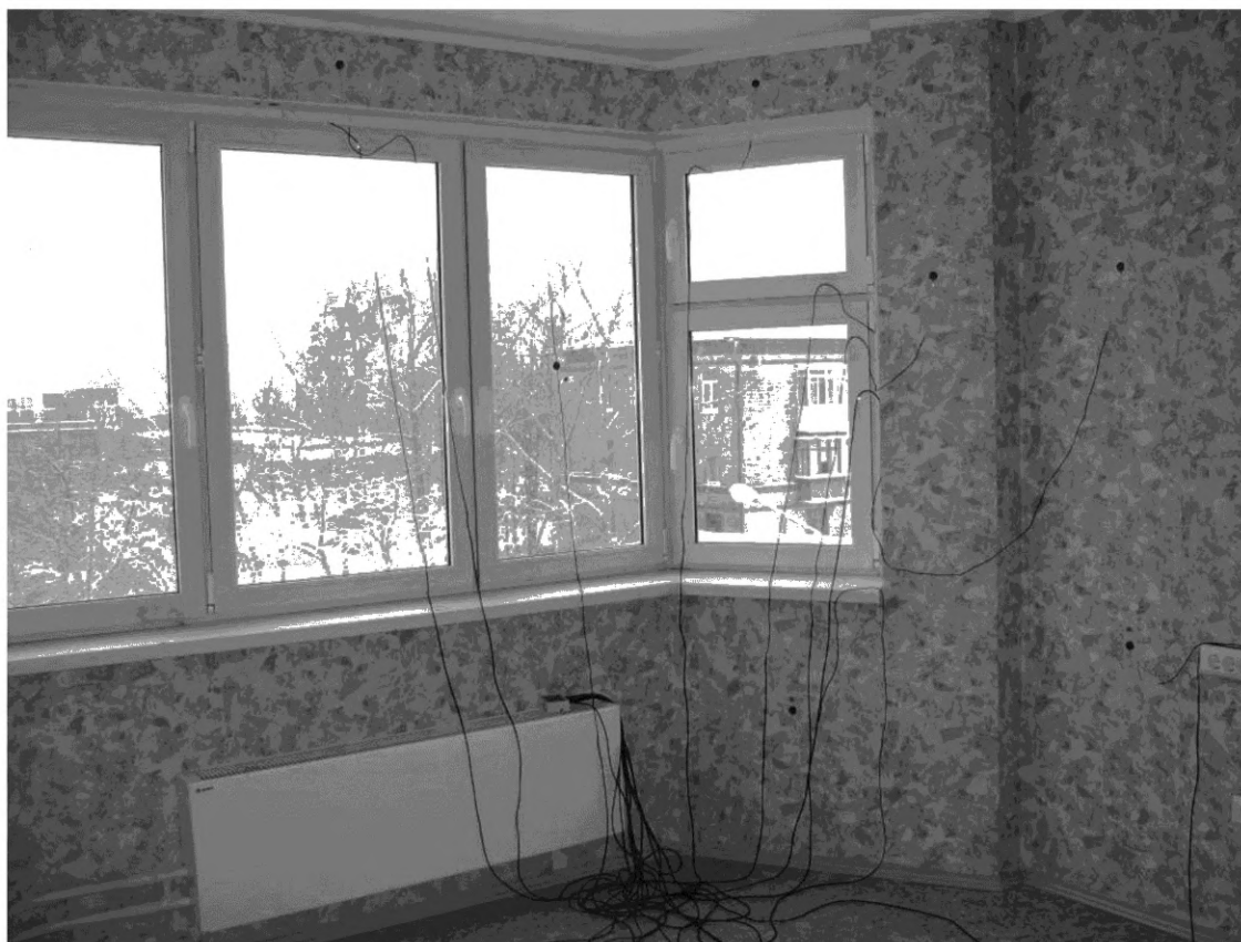
Рисунок А.1— Внешний вид наружной ограждающей конструкции, выбранной для проведения натуральных испытаний (вид изнутри)

А.7 Для измерения температуры воздуха помещения дополнительно закрепляют датчики температуры на стойках (подвесах) по центру испытуемой конструкции на расстоянии 0,15 м в трех горизонтальных сечениях с внутренней стороны ограждающей конструкции.