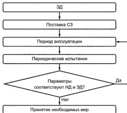
Рисунок 1 — Общая схема проведения контроля качества

4.2.1 Цель периодических испытаний состоит в подтверждении соответствия параметров СЗ требованиям ЭД и/или НД. Эти испытания проводят организации, аккредитованные в установленном порядке на данный вид деятельности, в соответствии с НД и/или ЭД.