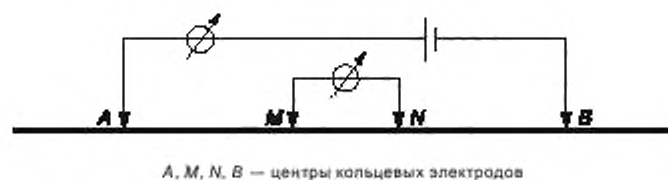
Рисунок А.2 — Электрическая (симметричная четырехэлектродная) схема электрокаротажного модуля зонда