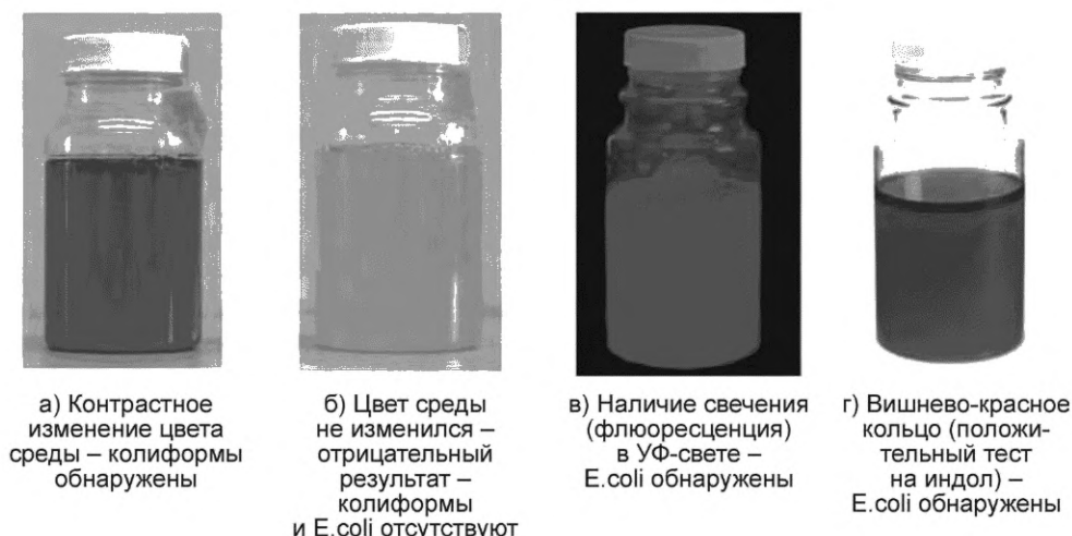
Рисунок 1 — Изменение цвета среды ReadyCult Coliforms 100 или с аналогичными характеристиками при определении наличия/отсутствия колиформных бактерий и E. coli в 100 см 3 воды