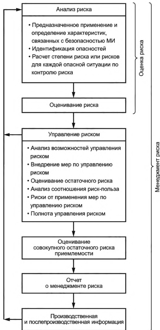
Рисунок В.1 — Схематическое представление процесса менеджмента риска (см. ISO 14971)