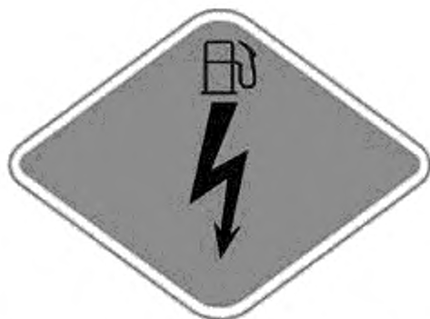
Рисунок 4 — Вид идентификационной наклейки типа В АТС с КЭУ

4.2.7 Идентификационная наклейка типа В должна быть расположена на элементах остекления АТС с комбинированными энергоустановками, включающих высоковольтное оборудование: