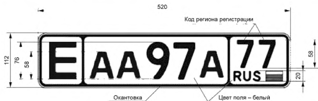
Рисунок А.1 — Пример заполнения однострочного регистрационного знака

А.1 На рисунках А.1 и А.2 показаны примеры заполнения однострочного и двухстрочного регистрационных знаков.