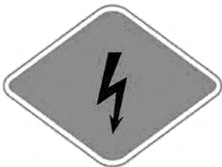
Рисунок 3 — Вид идентификационной наклейки типа А электромобиля