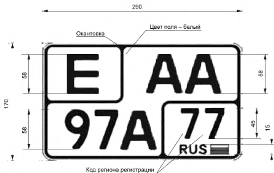
Рисунок А.2 — Пример заполнения двухстрочного регистрационного знака