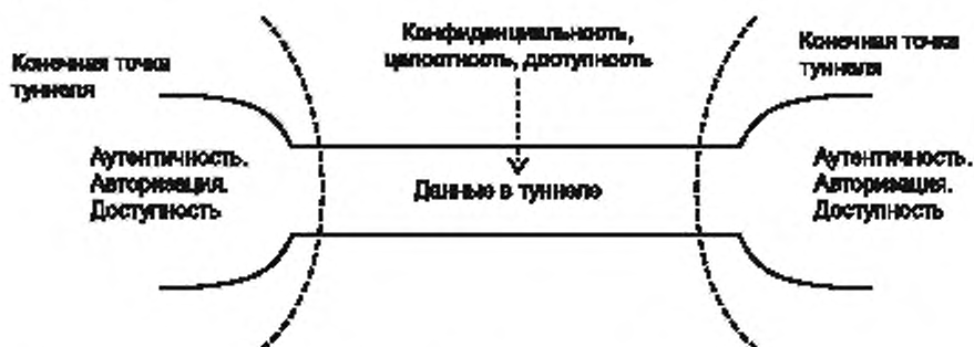
Рисунок 2 — Общие требования безопасности ВЧС, сопоставленные с базовым туннелем

Это, в свою очередь, подразумевает необходимость такой реализации базовых туннелей, используемых для создания ВЧС, которая обеспечит достижение целей в сфере безопасности. Эти цели представлены на рисунке 2.