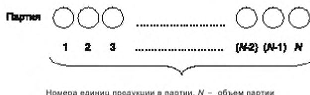
Рисунок А.1 — Представление продукции на контроль способом «ряд»

К продукции, поступающей на контроль способом «ряд», можно отнести электродвигатели, пакеты химикатов, бутылки растительного масла и т. п. (рисунок А.1).