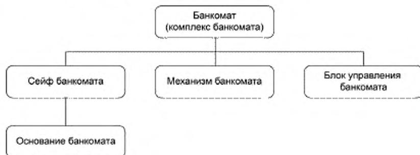
Рисунок 1 — Пример комплекса банкомата

2 Из устройств, показанных на рисунке 1, механизм банкомата и блок управления банкомата не подлежат испытаниям в соответствии с настоящим стандартом.