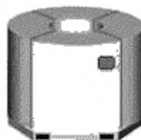
а) Бухта с вертикальной осью вращения

9.1 Для обеспечения целостности каждая бухта катанки должна быть плотно перевязана не менее чем в трех местах отрезками катанки или упаковочной лентой способом, исключающим рассыпание или перекося бухт при транспортировании, и отгружаться потребителю, например, на деревянных поддонах, предохраняющих катанку от механических повреждений при транспортировании. Бухту на поддоне располагают двумя способами, которые определяются положением ее оси вращения (рисунок 3). Требование к расположению оси бухты, являющееся обязательным к исполнению, указывают в соглашениях на поставку между потребителем и изготовителем