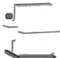
б) Бухта с горизонтальной осью вращения