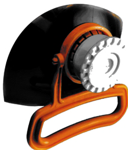
Рисунок А.4 — Съёмные ручки для кег (бутылей)