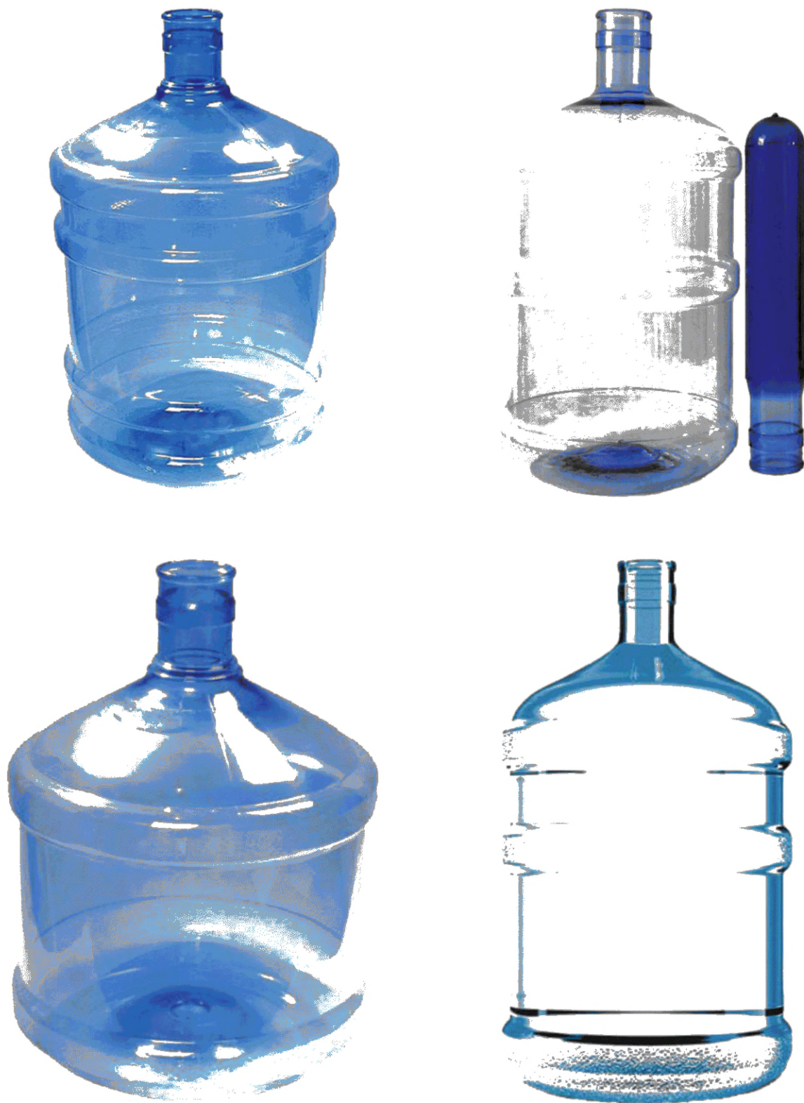
Рисунок А.2 — Бутыли без ручек