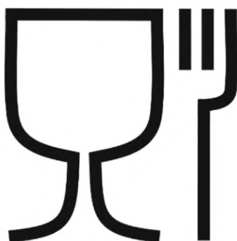
Рисунок Б.2.1 — Символ для упаковки, предназначенной для контакта с пищевой продукцией, допускается наносить без рамки или в рамке (круглой, квадратной и др.)

Б.2 Символы, наносимые на бутылку и/или сопроводительную документацию