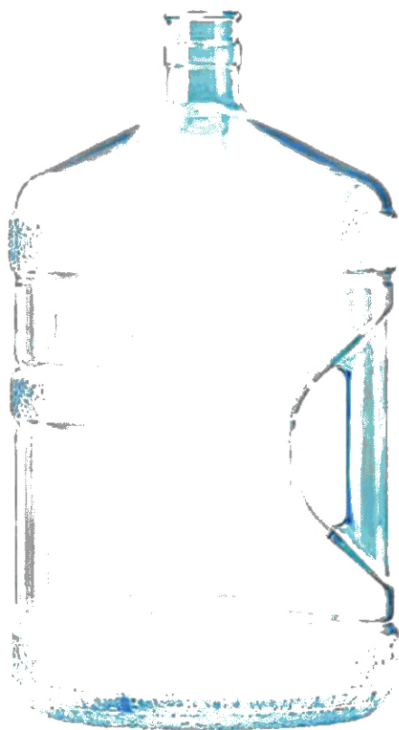
а – бутылка с полкой ручкой