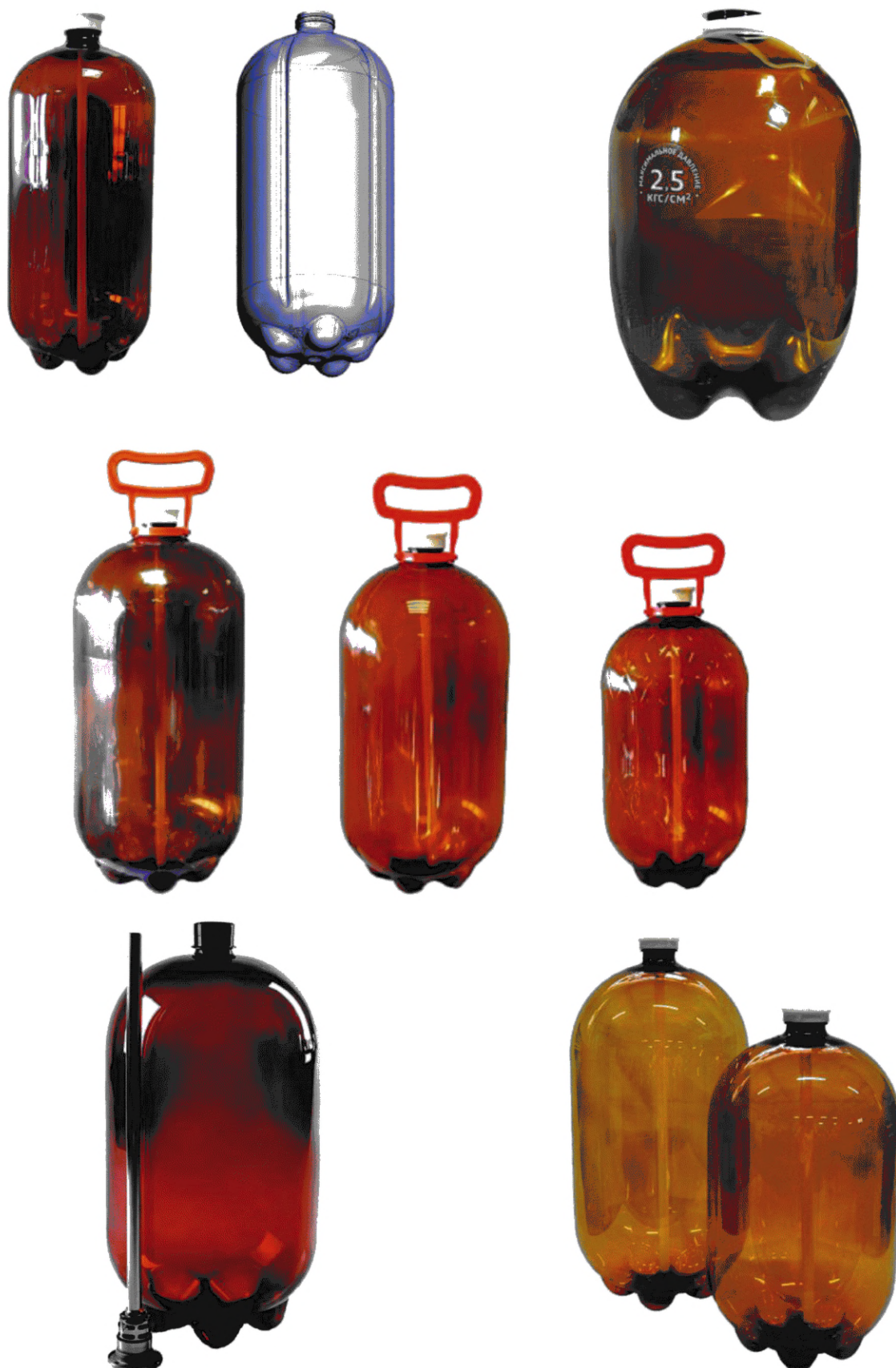
Рисунок А. 3 — Кеги (бутыли)