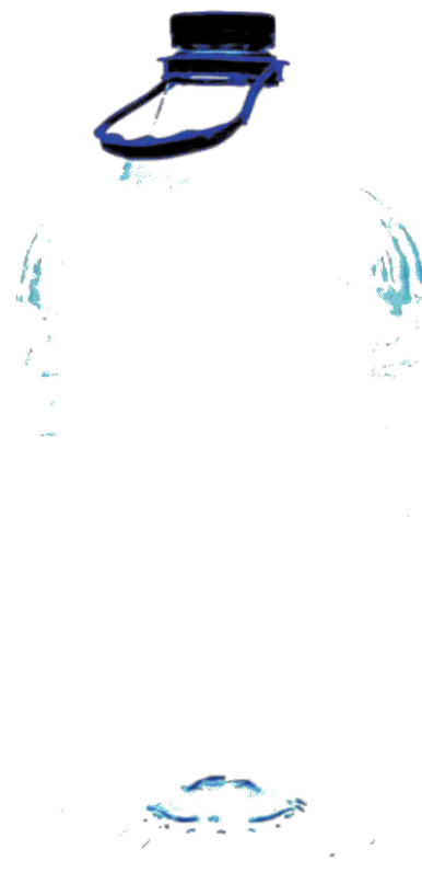
б – бутылка со съёмной ручкой