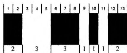
Рисунок 4 — Знак Stop для Code 128

знакам данных, приведенным в графах с заголовками «Кодируемый набор А», «Кодируемый набор В» или «Кодируемый набор С». Выбор кодируемого набора зависит от знака Start или использования