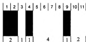
Рисунок 2 — Знак Start A для Code 128

На рисунке 2 приведен знак Start A для Code 128.