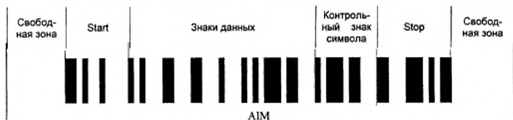
Рисунок 1 — Символ Code 128

На рисунке 1 представлен символ Code 128, кодирующий текст «AIM».