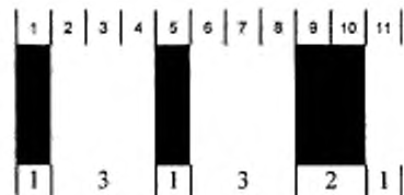
Рисунок 3 — Знак символа для значения 35

На рисунке 3 приведен знак символа с закодированным значением 35, который представляет знак данных C в кодируемых наборах A или B, или две указанные цифры 35 в кодируемом наборе знаков C.