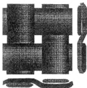
Рисунок 1 — Углеродная ткань полотняного переплетения

4.4.1 Полотняное плетение (Plain, P), изображенное на рисунке 1, характеризуется строгим чередованием основной и уточной нитей в соотношении 1:1. При этом если первая нить основы вышла на поверхность, то вторая закрывается уточной нитью, и т. д. Такое строгое чередование происходит по всей длине и ширине ткани. При этом получается материал, одинаковый с обеих сторон.