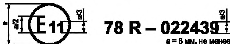
Образец А (см. 4.4 настоящих Правил)

Приведенный выше знак официального утверждения, проставленный на транспортном средстве, указывает, что этот тип транспортного средства официально утвержден в Соединенном королевстве (Е 11) в отношении тормозного устройства на основании Правил ЕЭК ООН № 78 под номером официального утверждения 022439. Первые две цифры номера официального утверждения указывают, что в момент предоставления официального утверждения Правила ЕЭК ООН № 78 уже включали поправки серии 02.