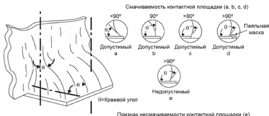
Рисунок 1 — Варианты краевого угла смачивания припоя \theta , виды состояний

Допустимое паяное соединение должно проявлять признак смачивания и сцепления, если припой соединяется с паяемой поверхностью, образуя краевой угол смачивания 90^\circ или меньше, за исключением случаев, когда количество припоя приводит к контуру, который заходит за края контактной площадки (рисунок 1). Рекомендуется, чтобы паяные соединения имели в основном гляцевый вид.