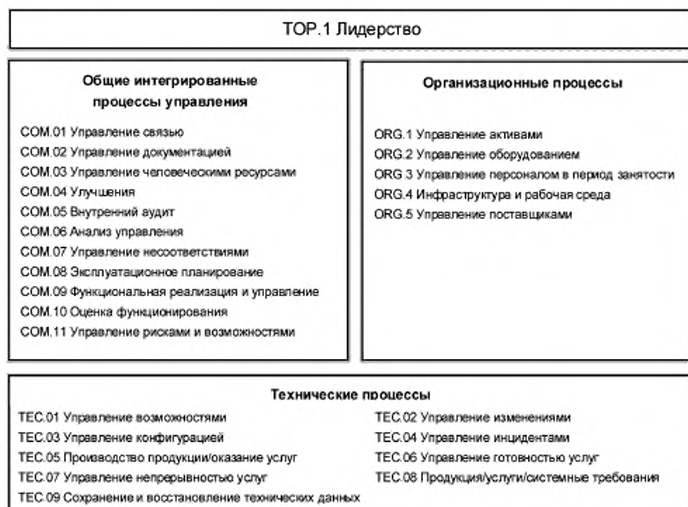
Рисунок 2 — Процессы в ЭМП