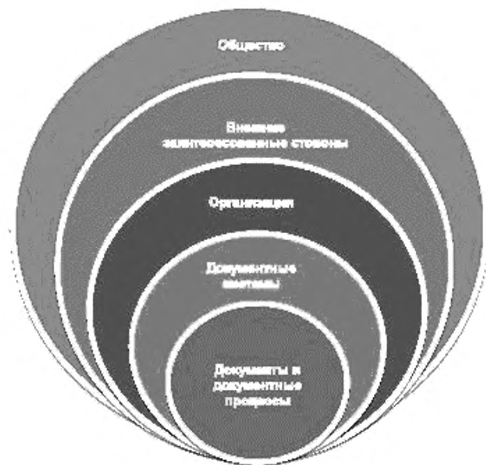
Рисунок 2 — Множественность слоев контекста для документов и документных процессов организации

Различные подразделения организации могут иметь разные точки зрения на неопределенности, связанные с последствиями изменений внешнего контекста (см. рисунок 2). Кроме того, следует иметь в виду, что любые изменения открывают новые возможности, последствия которых могут быть и положительными.