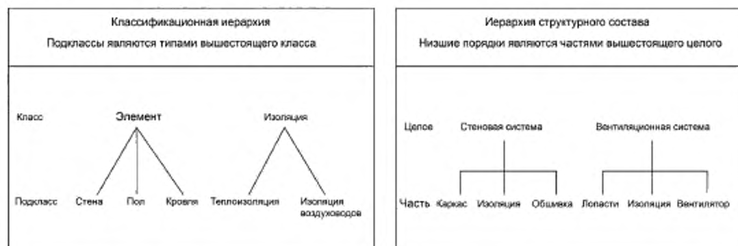
Рисунок 2 — Иерархия классификации и иерархия структурного состава

Примечание — Рисунок 3 служит для иллюстрации принципа и не направлен на стандартизацию каких-либо классов, подклассов или их частей.