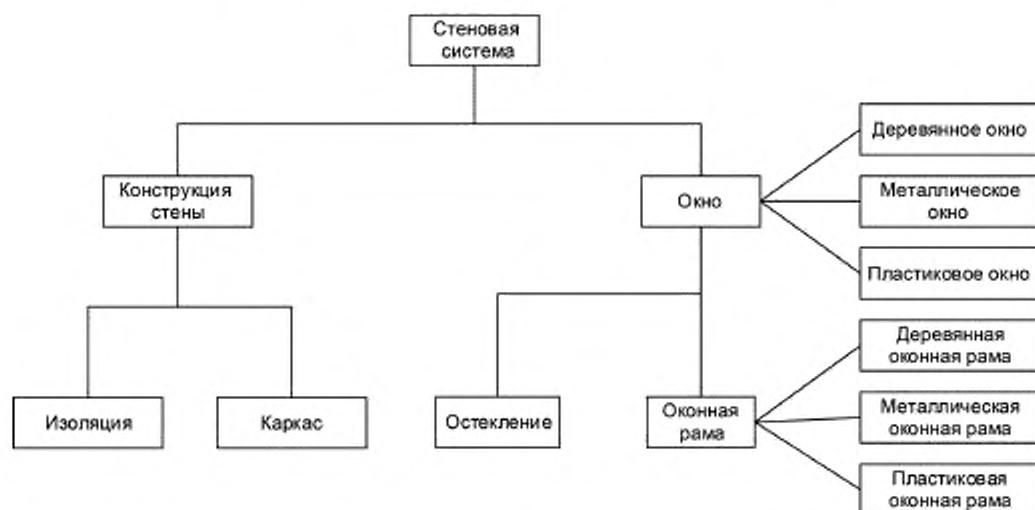
Рисунок 3 — Иллюстрация структурного состава и классификации