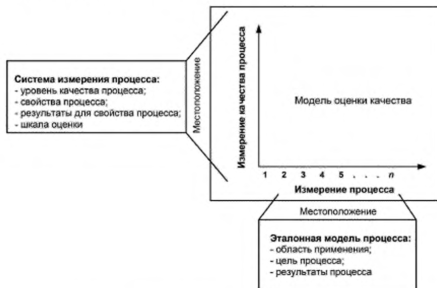
Рисунок 2 — Взаимоотношения в рамках модели оценки процесса

Оценку процесса проводят путем сравнения результатов выполнения данного процесса (процессов) в организационном контексте с ожидаемыми результатами выполнения, заданными в модели оценки процесса. В модели оценки процесса совмещается базовый состав описаний процесса одной или более эталонных моделей процесса с конструкциями и элементами, описанными в выбранной системе измерения процесса. На рисунке 2 приведены отношения между моделью оценки процесса, соответствующей эталонной моделью процесса и системой измерения процесса. Двухмерная модель, изображенная на рисунке 2, состоит из состава процессов, созданного с учетом их целей и результатов, и системы измерения процесса, которая содержит состав свойств процесса, относящихся к нужным качественным характеристикам процесса. Свойства могут применяться ко всем процессам. Свойства могут быть сгруппированы в уровни качества процесса. Эти уровни могут быть использованы для описания процесса. В результат оценки входит состав профилей процесса и, если необходимо, система оценок уровня качества для каждого из процессов.