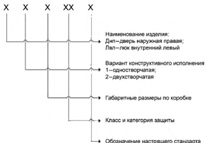
Примеры условного обозначения

4.3.2 Устанавливают следующую структуру условных обозначений ВЗК в документации при оформлении заказа.