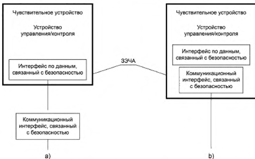
Рисунок 1 — Примеры ЗЭЧА, использующей коммуникационные интерфейсы, связанные с безопасностью

Примечание — Ввиду специфичности технологии коммуникационных интерфейсов применяют другие стандарты, отличные от IEC 61496-1. Чтобы избежать наложений на другие стандарты, функциональные требования к коммуникационному интерфейсу, связанному с безопасностью, данным стандартом не рассматриваются.