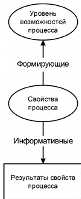
Рисунок А.1 — Формирующие и информативные измерения возможностей процесса

Уровень возможностей процесса характеризуется одним или более свойствами, которые представляют собой формирующие измерения возможностей процесса. Свойства процесса необходимы для конструирования возможностей процесса. Свойства процесса демонстрируются путем соответствия результатам свойства процесса, представляющим собой информативные измерения.