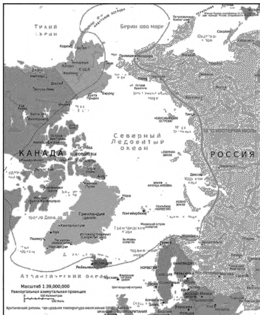
Рисунок А.1 — Арктический регион