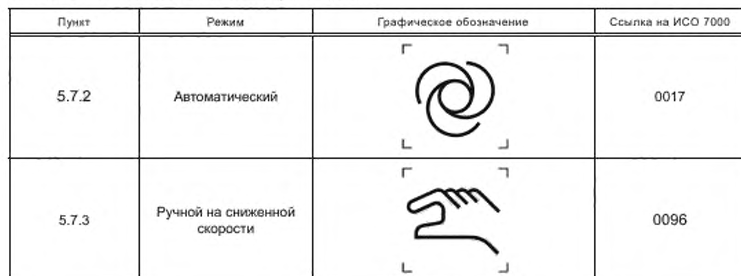
Таблица Е.1 — Обозначения режимов работы робота

В таблице Е.1 приведены примеры графических обозначений, которые могут быть использованы для обозначения режимов работы, определенных в 5.7. Дополнительный описательный текст может быть добавлен к графическим обозначениям для того, чтобы как можно яснее представить информацию о выборе режима и ожидаемых характеристиках.