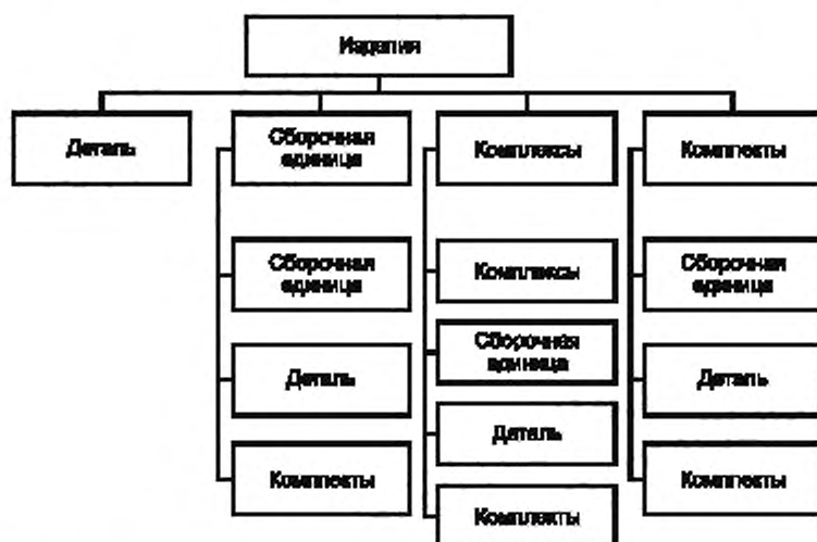
Рисунок А.1 — Виды и структура изделий по конструктивно-функциональным характеристикам

А.1 Схема видов изделий по конструктивно-функциональным характеристикам и их структура приведены на рисунке А.1.