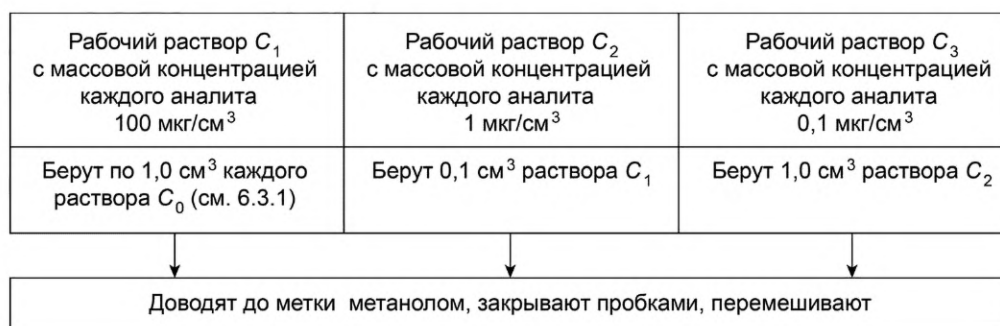
Рисунок 1 — Приготовление рабочих растворов C_1 , C_2 , C_3

Рабочие растворы C_1 , C_2 , C_3 готовят в мерных колбах вместимостью 10 см 3 согласно рисунку 1.