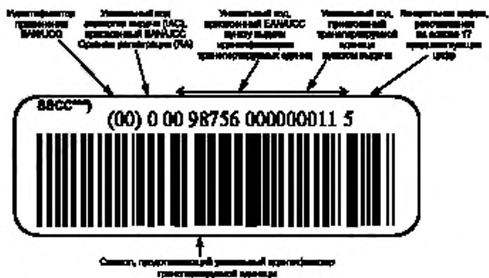
Рисунок В.1 — Пример представления уникальной идентификации транспортируемых единиц в символическом коде EAN/UCC 128 с идентификатором применения EAN/UCC «00» и визуальным представлением знаков

В.1 Пример представления уникальной идентификации транспортируемых единиц в символическом коде EAN/UCC 128* с идентификатором применения EAN/UCC** «00» и визуальным представлением знаков приведен на рисунке В.1.