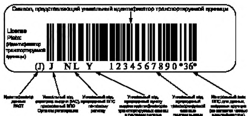
Рисунок В.2 — Пример представления уникальной идентификации транспортируемых единиц в символикe штрихового кода Code 128 (Код 128)

В.2 Пример представления уникальной идентификации транспортируемых единиц в символикe штрихового кода Code 128 (Код 128)** с идентификатором данных FАCT (ФАКТ)*** «Ј» и визуальным представлением приведен на рисунке В.2.