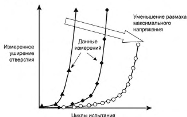
Рисунок 3 — Типичная зависимость расширения отверстия от количества циклов нагружения