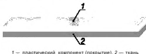
1 — пластический компонент (покрытие), 2 — ткань

В случае полностью обработанных образцов см. рисунок А.1.